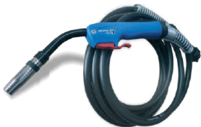
MIG ERGOPLUS 36 TORCH (3м) для механизмов подачи проволоки ФОРСАЖ-МПм, ФОРСАЖ-МП5, ФОРСАЖ-МПЦ02