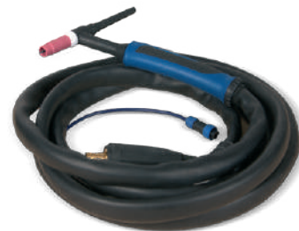
ABITIG GRIP 26 (4м) для сварочных аппаратов: ФОРСАЖ-201АД, ФОРСАЖ-200АС/DC, ФОРСАЖ-315АД, ФОРСАЖ-315АС/DC, ФОРСАЖ-500АС/DC