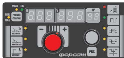
Панель управления. Расширенная модификация

Регулируемый HOT START Регулируемый ARC FORCE Регулируемая функция «Наклон ВАХ» Регулируемая функция «Индуктивность» Регулируемая функция «Базовый ток» Регулируемая функция PILOT ARC Импульсный режим Хранение 72-х пользовательских программ