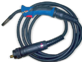
MB 15AK GRIP (3м) для сварочного аппарата ФОРСАЖ-200ПА