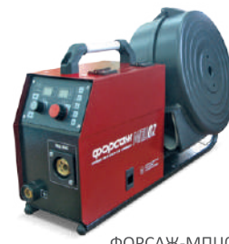
ФОРСАЖ-МПЦ02 с защитным кожухом

ФОРСАЖ-МПЦ02 внесен в реестр СТО Газпром 2-3.5-046-2006.