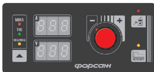
Панель управления. Базовая модификация

Отключаемый HOT START Нерегулируемый ARC FORCE